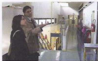
Visite énergétique (projet de réhabilitation de l'école des Ajoncs à Issy-les-Moulineaux)