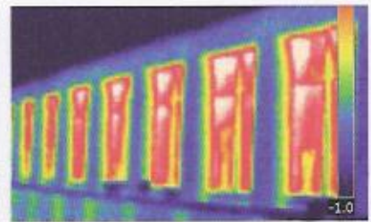
Thermographie infrarouge (école Muguet à Chaville)