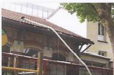
Accompagnement de l'isolation des combles de l'école Gambetta à Vanves