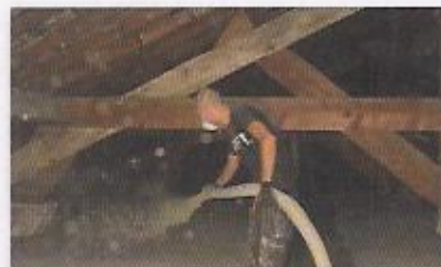
Isolation écologique des combles de l'école Gambetta à Vanves

L'accompagnement de la Ville de Vanves a débuté en 2009 avec l'élaboration d'une base de données et la réalisation de suivis des consommations sur un modèle élaboré par l'ALE. Suite à la création d'un poste d'Econome de flux au sein des services techniques, la ville a effectué les Bilans Énergétiques Simplifiés (BES) de tous ses bâtiments, sur le modèle d'un BES réalisé en 2009 par l'ALE sur l'Hôtel de Ville de Vanves. Ce travail, effectué en collaboration avec l'ALE, a donné lieu à l'identification des principaux dysfonctionnements des bâtiments et à l'élaboration d'une première trame de plan pluriannuel d'investissements axé sur les travaux d'économies d'énergie.